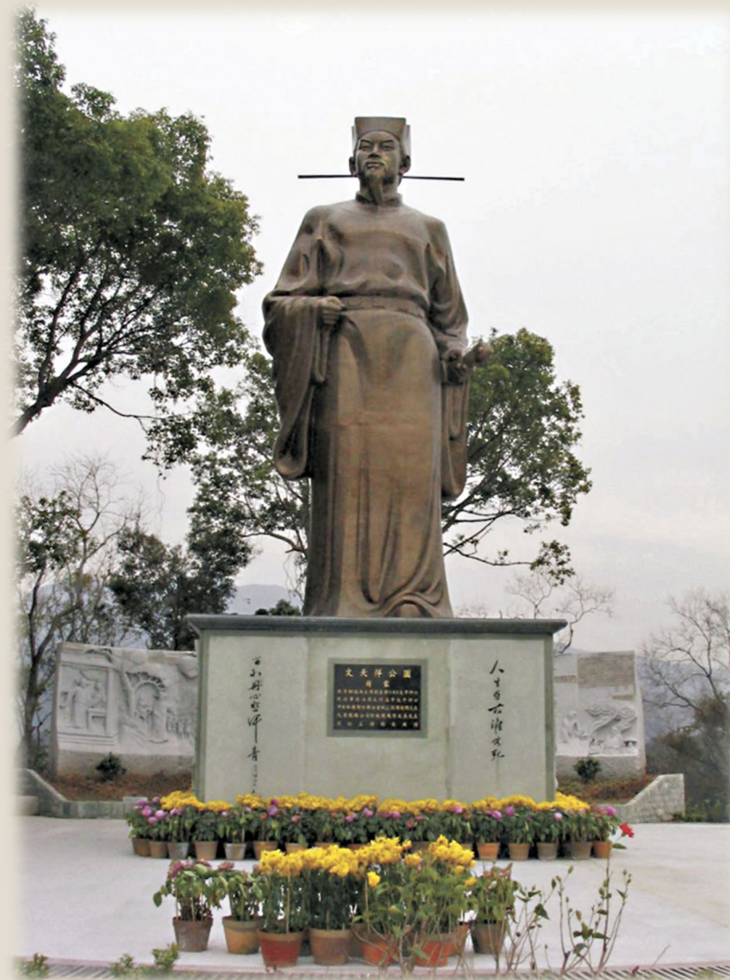
新田文天祥公園的文天祥像